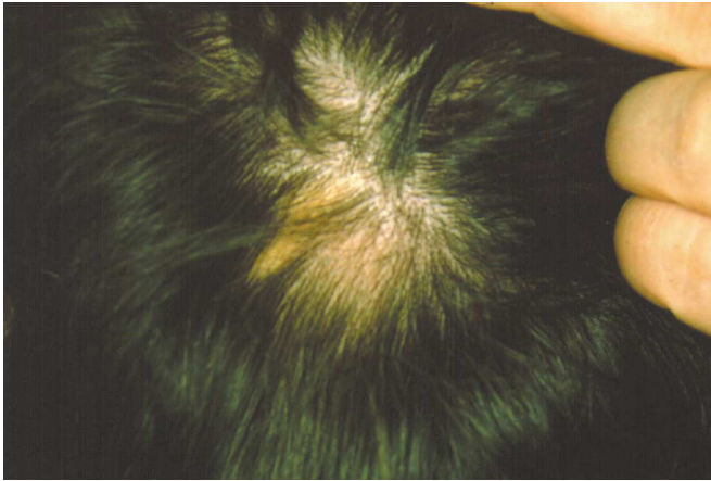
Fig. 3. Placa de alopecia tres meses después del tratamiento endodóntico. Hair loss three months after the endodontic treatment.

AA con la presencia de focos infecciosos, con factores endocrinos (7), con factores genéticos (8-10), con factores psicológicos (11) y otros como irritaciones reflejas de origen ocular o dental (como es la presencia de dientes incluidos) y traumatismo en la cabeza con posteriores pérdida del pelo localizada (3). Sin embargo, actualmente se la considera como una enfermedad básicamente autoinmune (12). Los modelos de experimentación en animales han avalado esta teoría además de observaciones indirectas (13), tales como que es una enfermedad sistémica que puede alcanzar el pelo, los ojos y las uñas, su asociación con otras enfermedades autoinmunes, la presencia de infiltrados inflamatorios en los folículos pilosos, alteraciones no específicas en el número de células T circulantes, etc. Además, el hecho de que los tratamientos que se han demostrado efectivos para la AA tienen como común