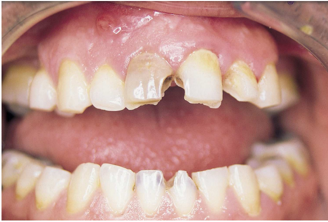
Fig. 1. Necrosis y fístula dental en el incisivo central superior derecho. Necrosis and dental fistula involving upper central incisor.