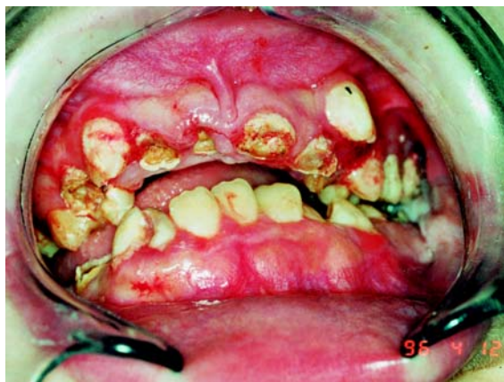
Fig. 1. Niña de 15 años con parálisis cerebral. Se realiza una sesión de odontología conservadora, periodoncia y exodoncia de restos radiculares. A 15-year-old girl with cerebral palsy. Conservative dental management was carried out, with periodontics and extraction of root remnants.