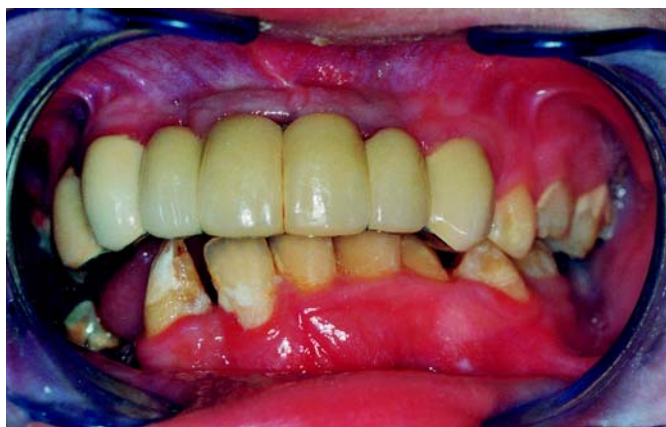
Fig. 2. (Paciente Fig. 1) Prótesis dento-implanto soportada con pilares naturales en 13 y 23. (Patient Fig. 1) A dental-implant-supported prosthesis with natural abutments in 13 and 23

de los años (potencial de crecimiento residual), evitar en edades tempranas los segmentos posteriores de ambos maxilares, crecimiento de las estructuras aéreas (senos maxilares, fosas nasales) a lo largo de la vida del paciente (18,19). En los dos casos se colocaron dos implantes en el segmento anterior para reponer los dientes perdidos 11 y 41, la alternativa de una prótesis fija convencional hubiera supuesto la ferulización de dientes a ambos lados de la línea media, colapsando el crecimiento transversal del maxilar.