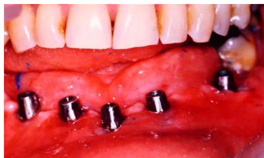
Fig. 4. (Caso de la Fig. 3). Pilares atornillados sobre los que descansa la prótesis cementada.

A 44-year-old woman with cerebral palsy . Detail of the facial arch registry of the patient, under general anesthesia.